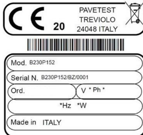
Рисунок 1 – Маркировка систем

Пломбировка систем изготовителем не предусмотрена.