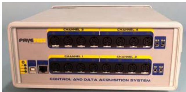
Рисунок 2 – Общий вид блока управления