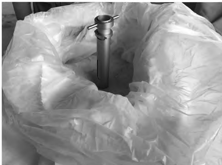
Рисунок 3 — Отбор точечных проб пробоотборной трубкой из упакованного материала

5.4.3 При применении пробоотборной трубки, трубку погружают в материал вертикально на максимально возможную глубину (рисунок 3). Вращают трубки, входящие в состав пробоотборной трубки, вследствие чего материал попадает в пробоотборную трубку.