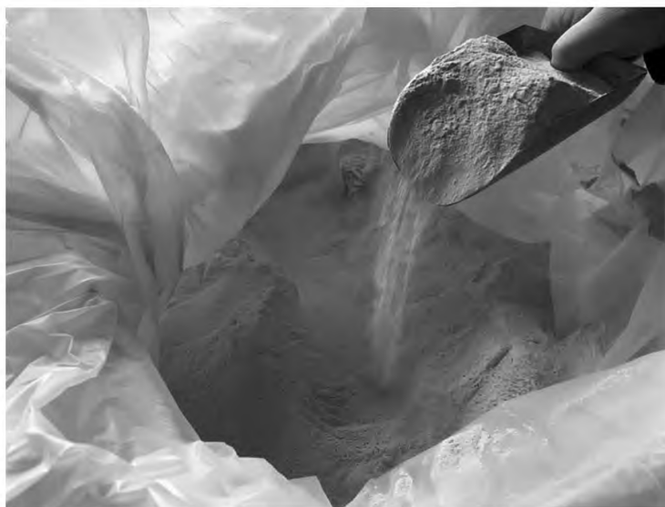
Рисунок 2 — Отбор точечных проб совком из упакованного материала

5.4.2 При применении совка отбор проб необходимо проводить из лунки глубиной не менее 10 см (рисунок 2).