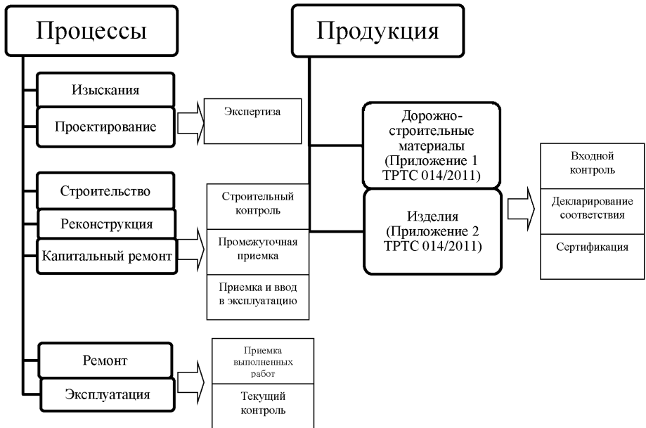
Рисунок 3 – Формы оценки соответствия предусмотренные ТР ТС 014/2011