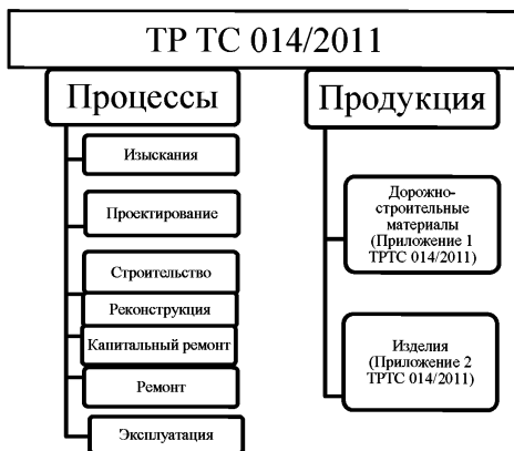
Рисунок 2 - Объекты технического регулирования ТР ТС 014/2011

Объекты технического регулирования ТР ТС 014/2011 [3] представлены на рисунке 2.