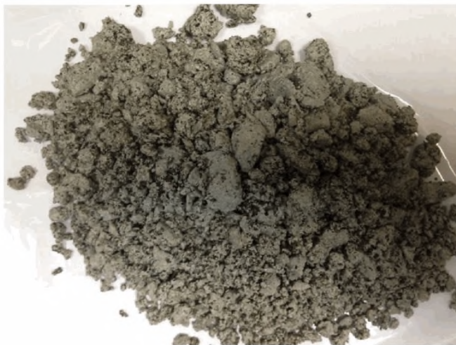
Рисунок А.1 – Смесь с битумной эмульсией не пригодной для приготовления органоминеральных смесей по показателю обволакиваемости

На рисунке А.1 показан образец смеси с битумной эмульсией, не пригодной для приготовления органоминеральных смесей по показателю обволакиваемости, на рисунке А.2 – с пригодной.