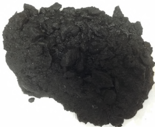
Рисунок А.2 – Смесь с битумной эмульсией пригодной для приготовления органоминеральных смесей по показателю обволакиваемости

Оценку совместимости битумной эмульсии и минерального материала органоминеральной смеси по показателю сцепления выполняют с помощью пробы, прошедшей испытания на обволакиваемость.